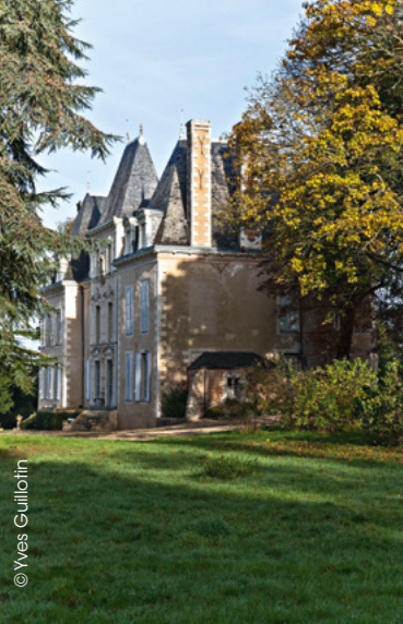
Château de la Porte à Daon